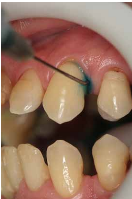
Figura 3 – Corante azul de metileno

Grupo A e B: Irrigação subgingival em toda a extensão do dente, por meio de seringa descartável, com 1 ml do fotossensibilizador azul de metileno (Chimiolux/Hypofarma – Belo Horizonte, MG, Brasil) o qual atuou por 5 min sob isolamento relativo. O excesso de corante extravasado foi lavado com água (Figura 3).