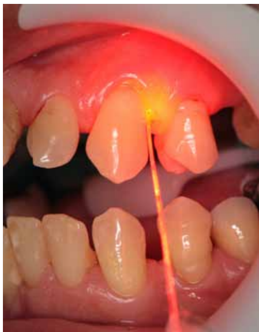
Figura 5 – Irradiação através da fibra óptica

ORELLANA CM CARVALHO VF ALVES VET PANNUTI CM CONDE MC DE MICHELI G TERAPIA FOTODINÂMICA COMO COADJUVANTE AO TRATAMENTO NÃO CIRÚRGICO DA PERIODONTITE CRÔNICA: COMPARAÇÃO CLÍNICA ENTRE DOIS MÉTODOS. ESTUDO PILOTO.