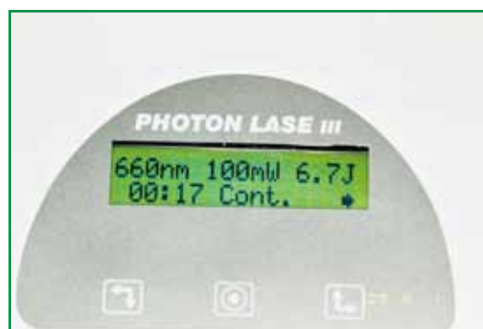
Figura 1 – Photon Laser III ®

Os dentes experimentais contralaterais foram alocados aleatoriamente em dois grupos, seguindo o desenho boca-dividida. O Grupo A recebeu a irradiação de maneira transgengival com o uso do aparelho Photon Laser III® (Photon Laser III–DMC, São Carlos, SP, Brasil) (Figura 1).