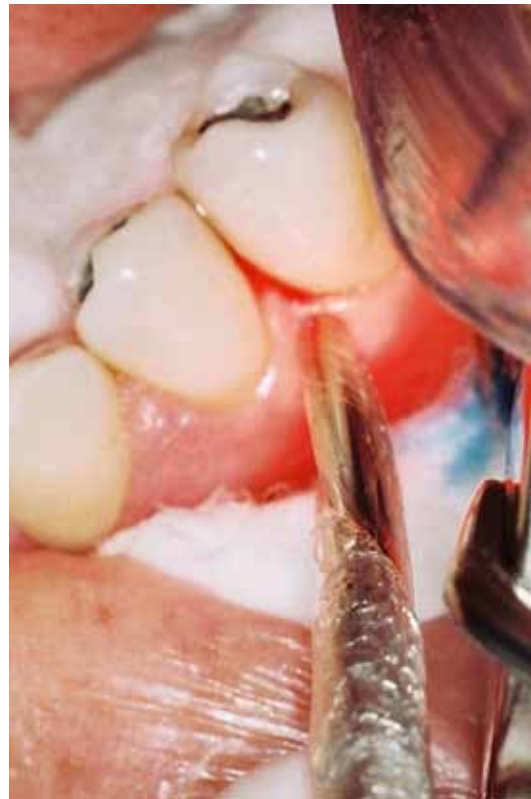
Figura 4 – Ponta ativa do Photon Lase III®

Grupo B: Os dentes foram submetidos a irradiação através da introdução da fibra óptica no interior da bolsa periodontal, previamente demarcada com o comprimento da PCS do sítio, com acionamento do aparelho de laser diodo de 30mW de potência por 120 s, com dose de 105 J/cm 2 , e movimentação da ponta da fibra de apical para cervical (Figura 5).